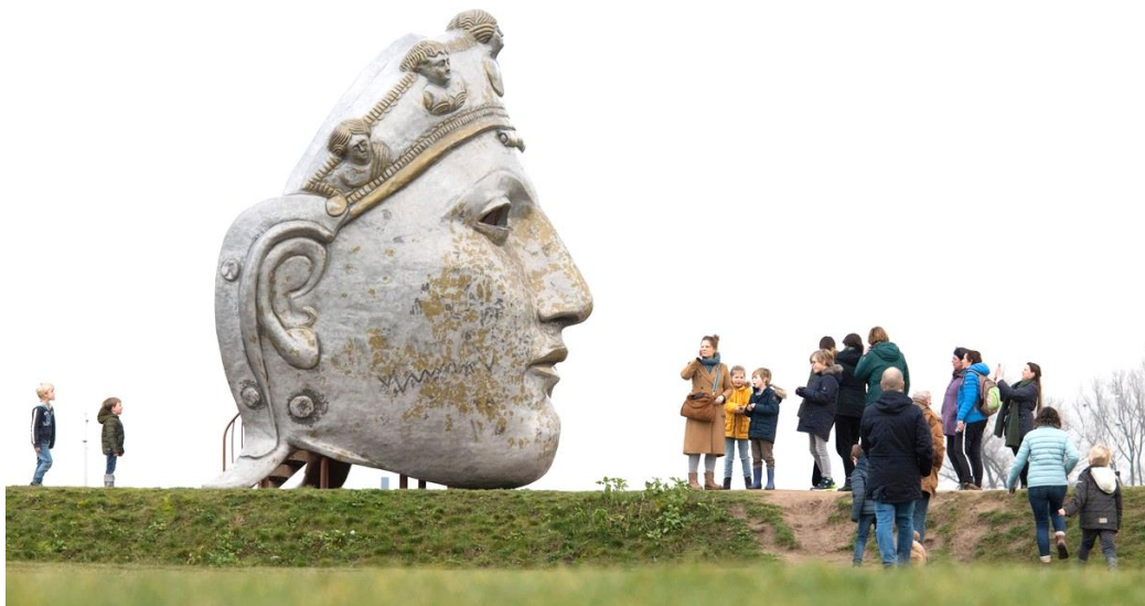
kunstwerk van mijn hand dat op stadseiland Veur Lent mensen met elkaar verbindt